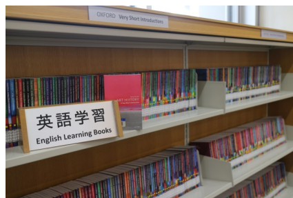
2階 英語学習コーナー

当館の英語学習コーナーを利用して、まずは英語に慣れ、次に例えばポピュラーサイエンスと言われるジャンルで、日本語訳もある洋書に挑戦し、最終的に分厚い学術書を駆使していってもらえると嬉しいです。