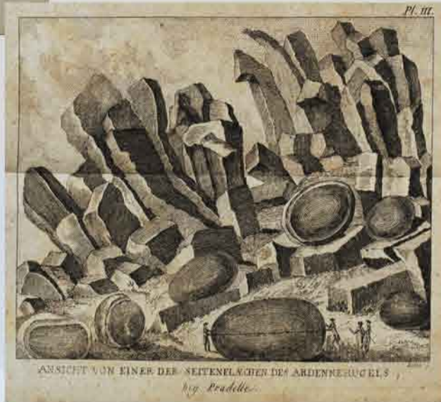
Mineralogie der Vulkane, oder 1786年 (フォジャ・ドゥ・サンフォン『火山の鉱物学』) 理学部中央図書館蔵

Histoire naturelle, generale et particuliere 1785-1791年