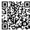
附属図書館 電子メールによる申請方法