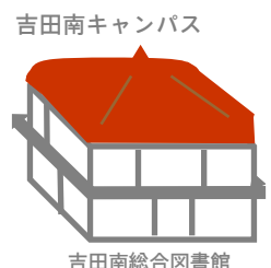
吉田南キャンパス

詳しくは吉田南総合図書館HP http://www.kulib.kyoto-u.ac.jp/yoshidasouthlib/